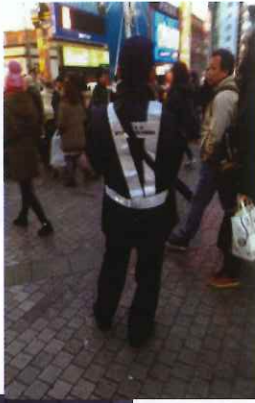
大坂戎橋をパトロール中の指導員

柏駅周辺は、客引き行為が常態化し、市民生活にも影響が生じ、これまで、関係防犯団体と協力して防犯パトロール等を実施しているものの問題解決とまでは至っていませんでした。今回視察を行った両市は、市条例を制定し、客引き対策指導員等を専従配置してパトロールや指導を実施した結果、客引きが半減したそうです。防犯協会としても今回の視察の成果を今後の風俗環境改善に向けて取り組んでいきます。