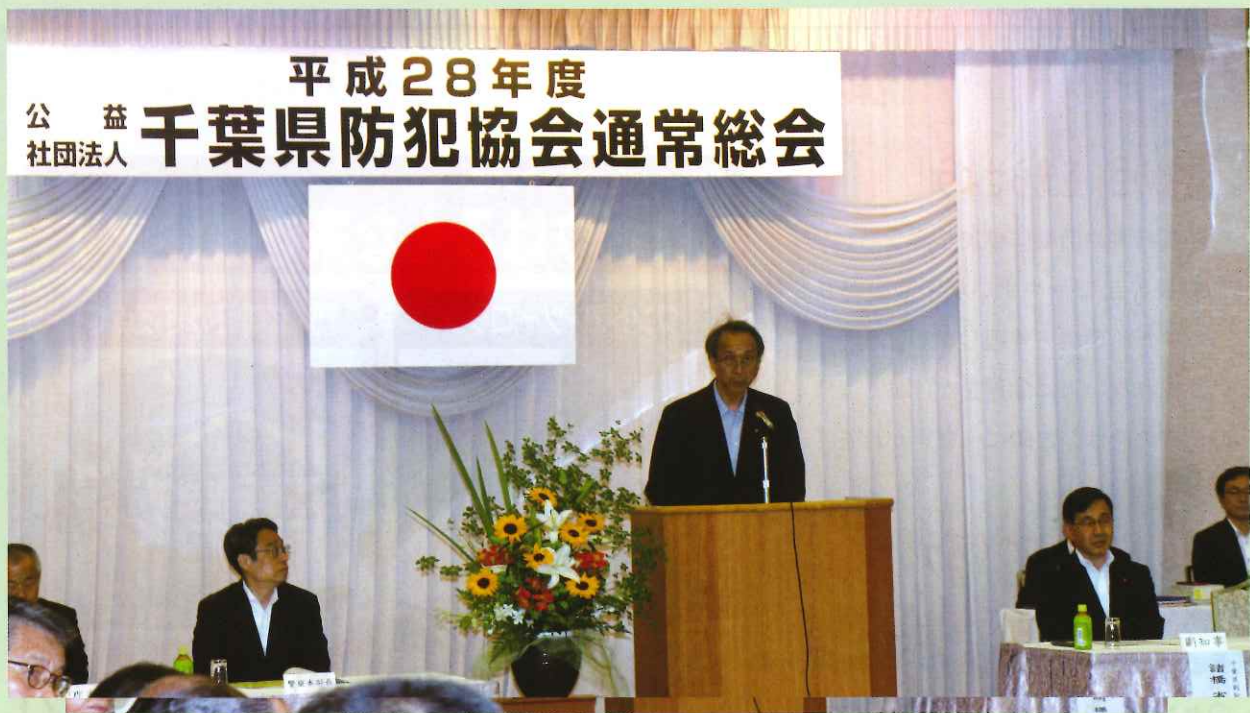
平成28年度 公益社団法人 千葉県防犯協会通常総会