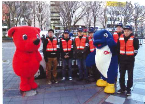
昨年の歳末警戒活動の状況

千葉県警察本部生活安全総務課犯罪抑止推進室 Tel 043-201-0110 (内3037)